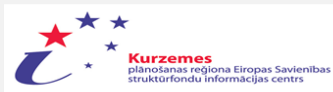
Attēls Nr.5. KRSIC logo

Lielu ieguldījumu sabiedrības informēšanā par notiekošo Kurzemē ES struktūrfondu un Kurzemes plānošanas reģiona darbībā sniedz Kurzemes plānošanas reģiona ES Struktūrfondu informācijas centrs (turpmāk – KRSIC), kas atrodas Saldū, Striķu ielā 2.