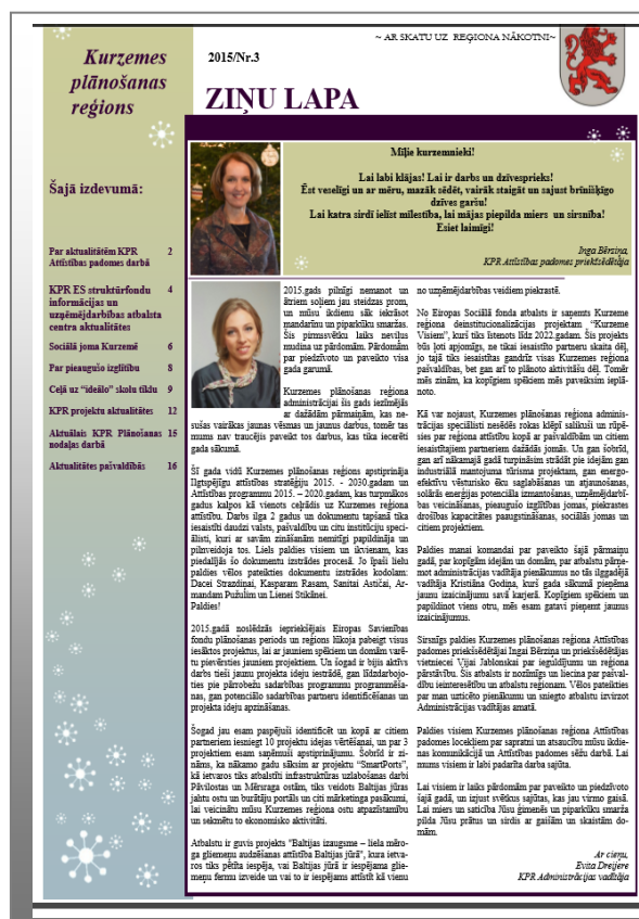
Attēls Nr. 4: http://www.kurzemesregions.lv

Pie izdevuma satura veidošanas piedalās visi Kurzemes plānošanas reģiona speciālisti, kas veido rakstus par konkrētām tēmām vai aktivitātēm, kurās tie piedalījušies vai īstenojuši reģiona ietvaros.