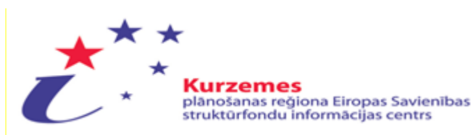
Attēls Nr.5: KRSIC logo

Lielu ieguldījumu sabiedrības informēšanā par notiekošo Kurzemē ES struktūrfondu un Kurzemes plānošanas reģiona darbībā sniedz Kurzemes plānošanas reģiona ES Struktūrfondu informācijas un uzņēmējdarbības centrs (turpmāk – KRSIC), kas atrodas Saldū, Striķu ielā 2.