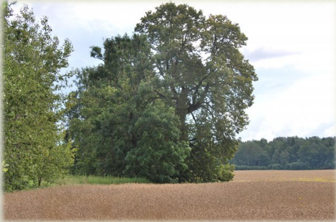
Ķoniņciema elku birzis