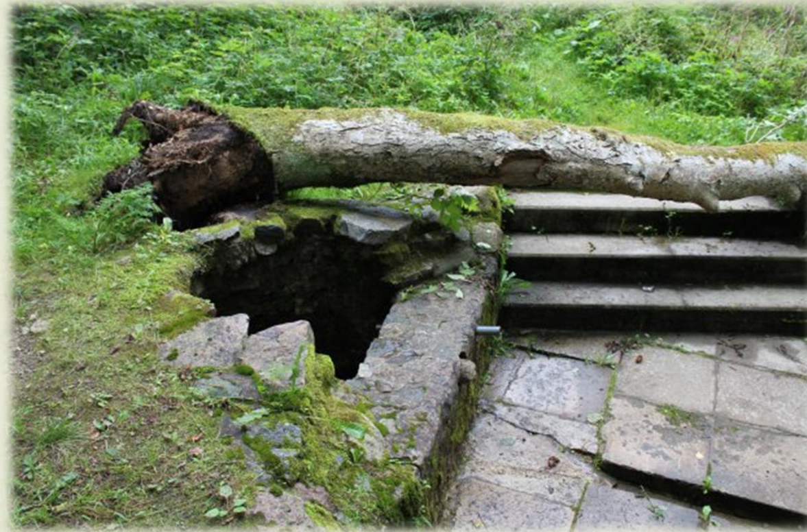
Orma kalna Veselības avots