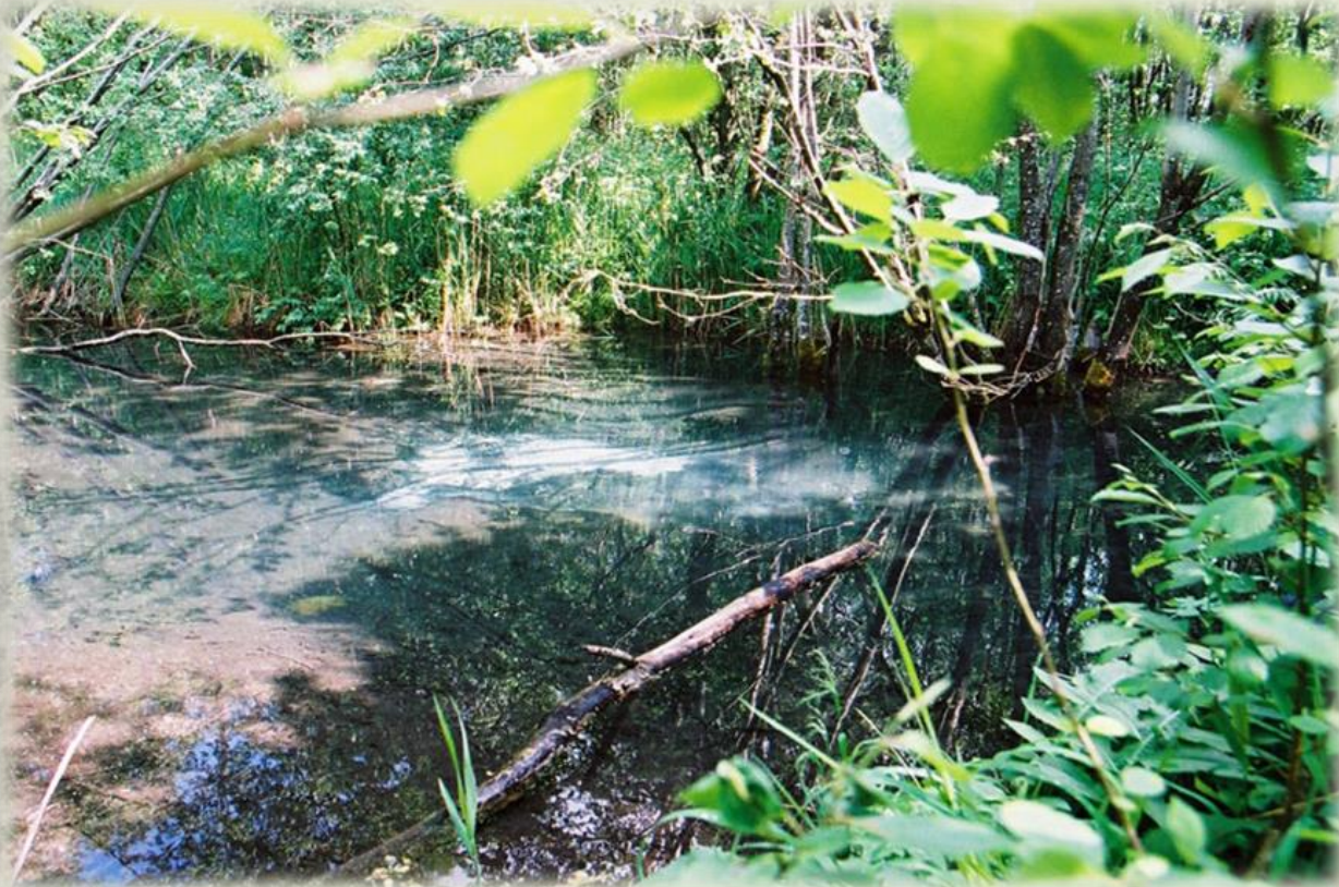
Elkuzemes Acs avots