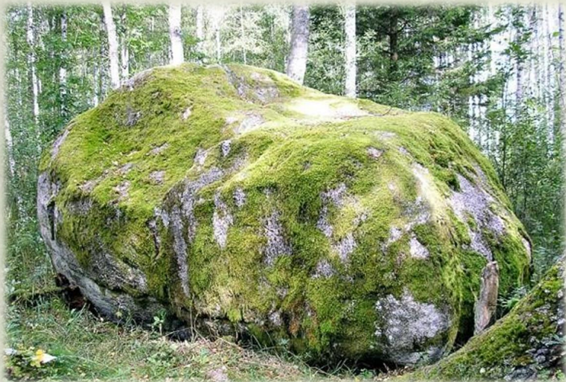
Upsīšu jeb Zeltapses dižakmens

“Pērkons nospēris koku. Pie nospertā koka saknēm atrasts melns apaļš kā kamolītis, ar sarkanu švītru pāri. Tā esot pērkoņa lode. Ar to varot dziedēt visādas slimības, tikai vajagot apriebt slimo vietu ar lodīti” (LFK 196, 49).