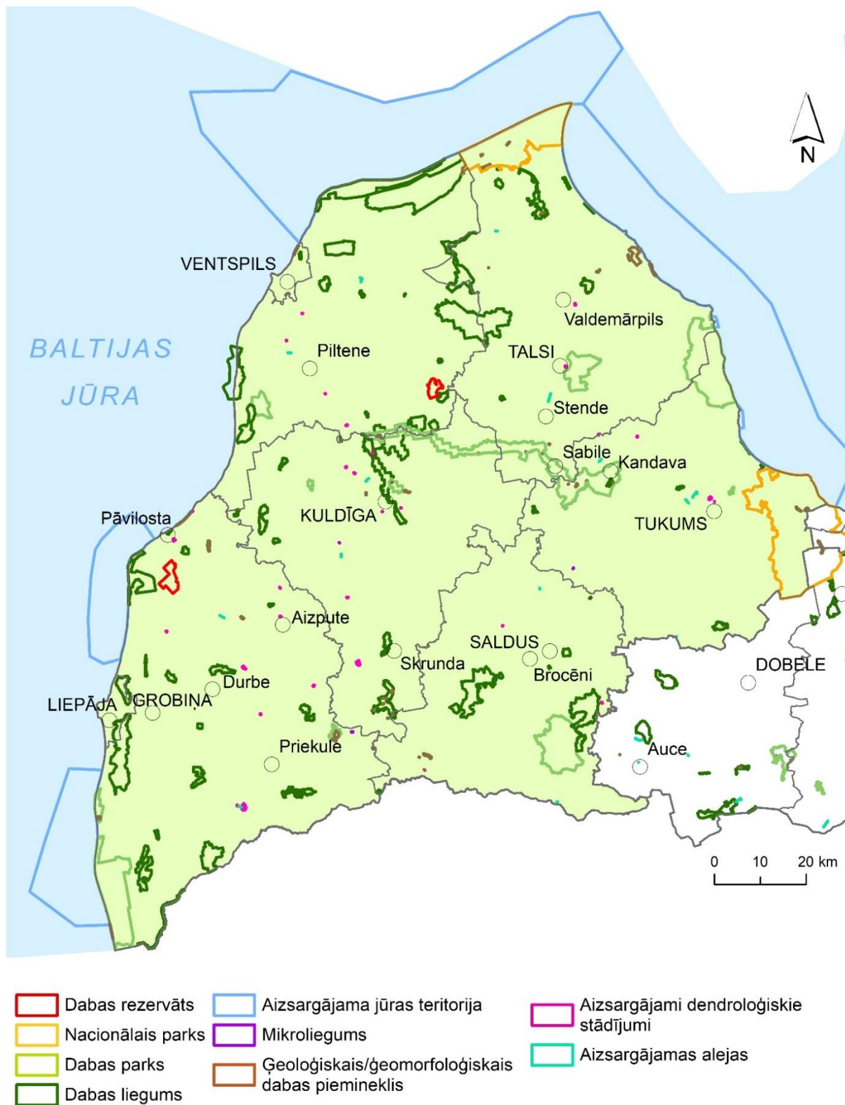
2.attēls. Īpaši aizsargājamās dabas teritorijas Kurzemes plānošanas reģionā. Karti sagatavoja Kurzemes plānošanas reģiona administrācija, 2021.