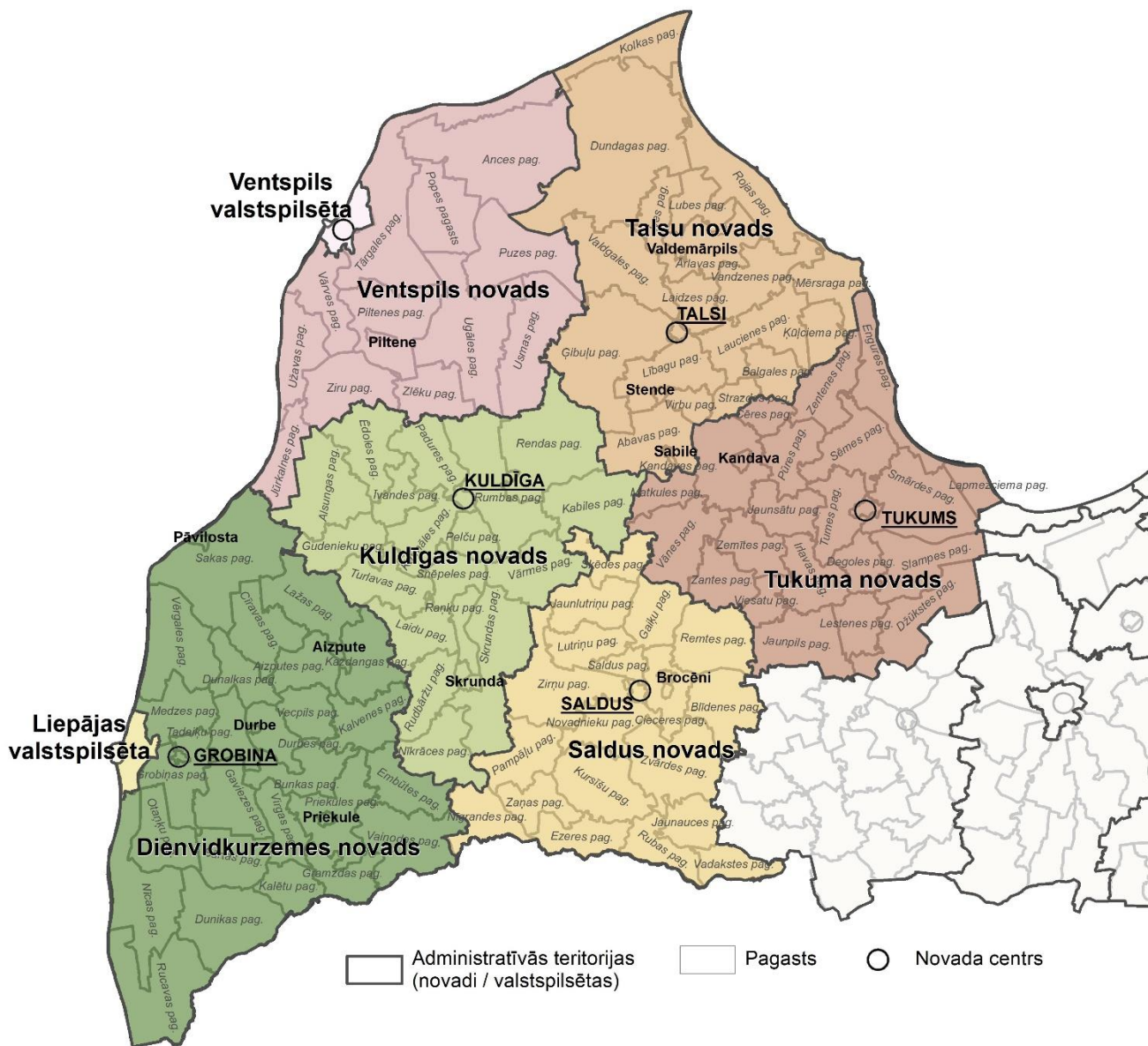
1.attēls. Kurzemes plānošanas reģiona teritorijas administratīvais un teritoriālais iedalījums. Karti sagatavoja Kurzemes plānošanas reģiona administrācija, 2021.